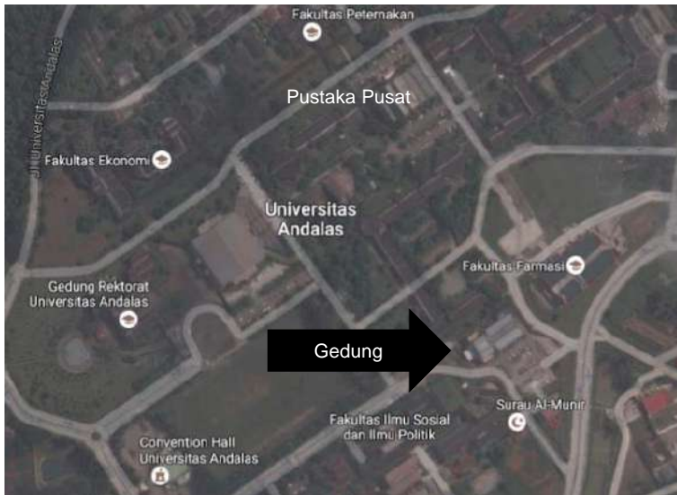
Gambar 1. Potret udara lokasi Gedung Pascasarjana Unand

Gedung Pascasarjana memiliki fasilitas tempat parkir dengan luas yang memadai untuk kendaraan roda dua dan roda empat, yang terletak dibagian samping gedung. Untuk sarapan dan makan minum, ada Queen Café yang berlokasi samping gedung Pascasarjana, di seberang tempat parkir.